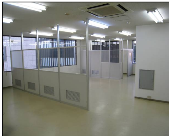
室内（ワンフロア貸）