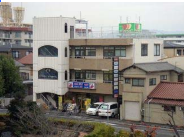
外 観 2