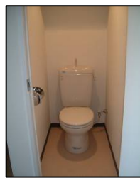
セパレートタイプ