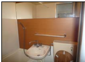
デザインリフォーム