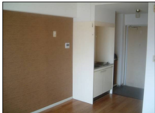
クロスデザイン貼り (ブラウン)