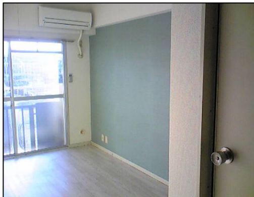
クロスデザイン貼り (グリーン)